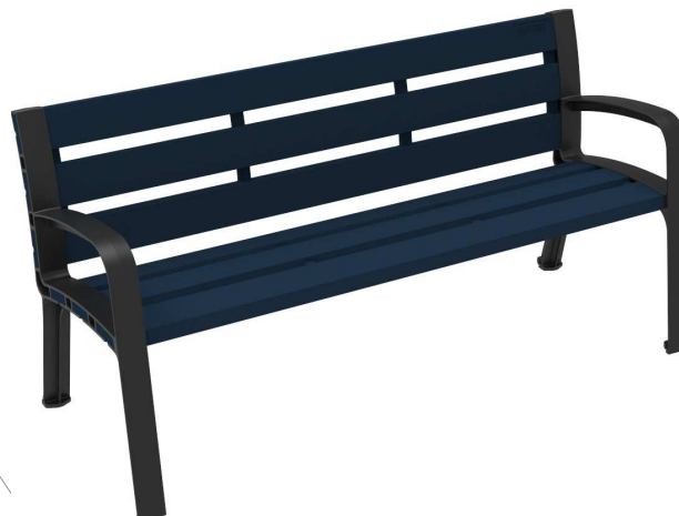
C-106-ECO-PLAST-COB ( RAL 5004 )