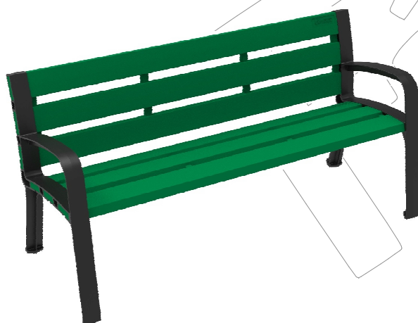
C-106-ECO-PLAST-VER ( RAL 6029 )