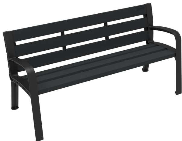
C-106-ECO-PLAST-GRI ( RAL 7021 )