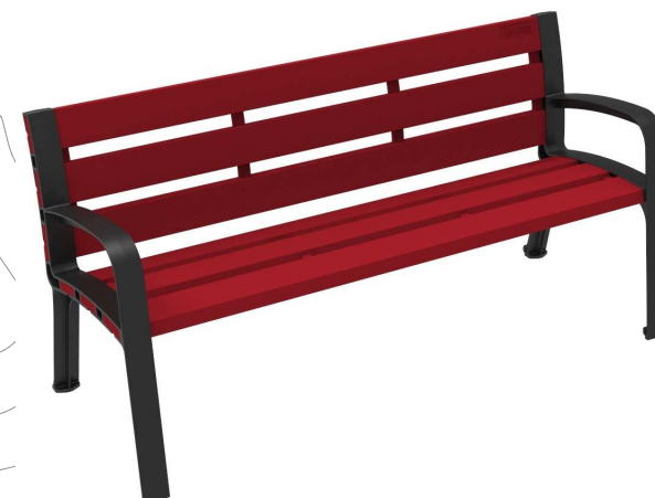
C-106-ECO-PLAST-ROJ ( RAL 3020 )