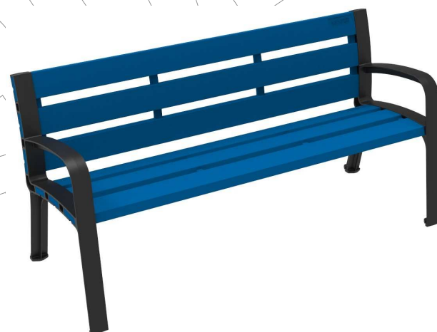
C-106-ECO-PLAST-AZU ( RAL 5005 )