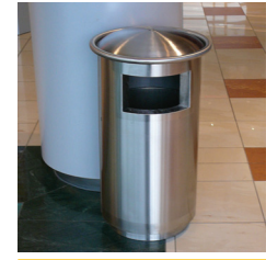
Plaza Centre - Sosnowiec Plaza Centre - Sosnowiec (Poland)