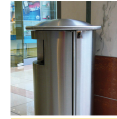
Plaza Centre - Sosnowiec Plaza Centre - Sosnowiec (Poland)