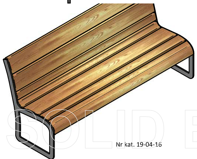
Nr kat. 19-04-16