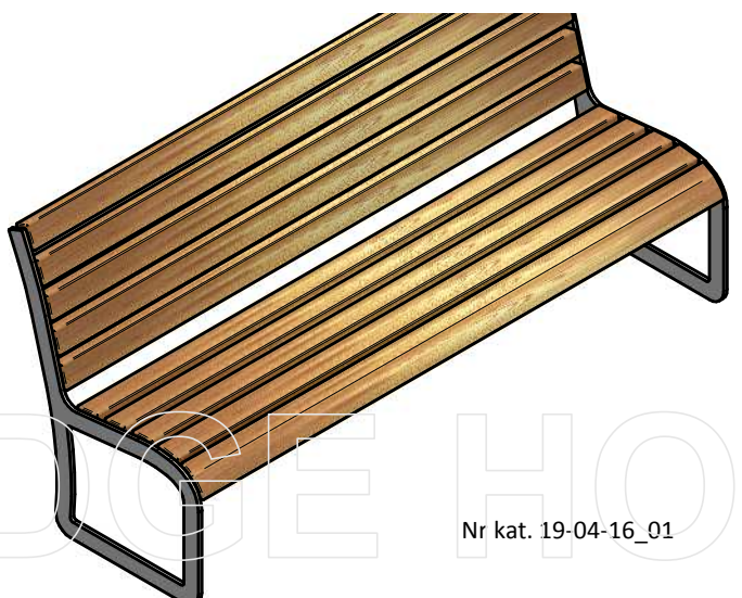
Nr kat. 19-04-16_01