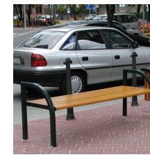
ul. Armii Ludowej - Sosnowiec Armii Ludowej avenue - Sosnowiec (Poland)