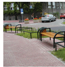
ul. Armii Ludowej - Sosnowiec Armii Ludowej avenue - Sosnowiec (Poland)