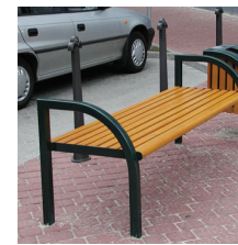
ul. Armii Ludowej - Sosnowiec Armii Ludowej avenue - Sosnowiec (Poland)